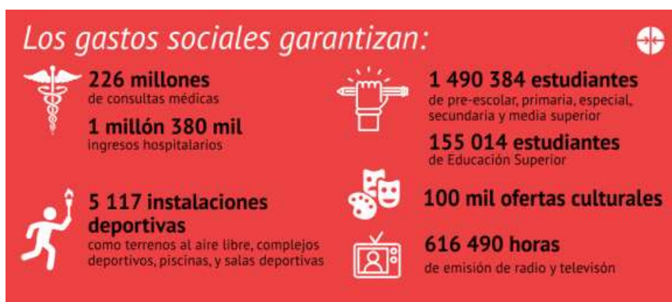
Gráfico 2. Gastos sociales en Cuba para el año 2019 136