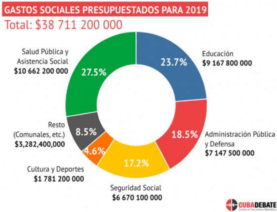
Gráfico 1. Gastos sociales en Cuba para 2019