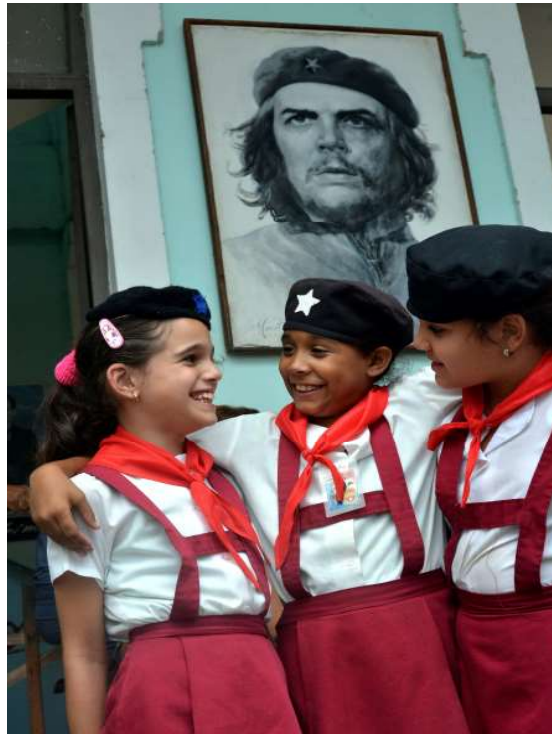
Gráfico 1. En las siguientes tres fotos se puede observar la atención integral educativa y temprana en Cuba, base de su desarrollo sostenible